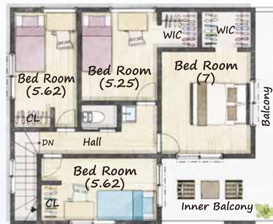
2 FLOOR / 59.62㎡