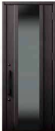
型番：M11 カラー：トリノバイン