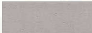
シマンフラット MWソイルミドルグレー