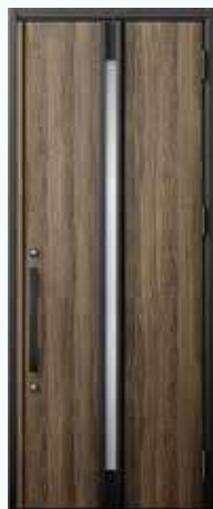
型番 : M22 カラー : ラスティックオーク