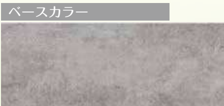
フィエルテ QF フィエルテ チタン ダークコンクリート