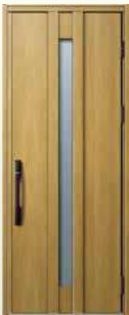
型番：C07N カラー：ナチュラルオーク