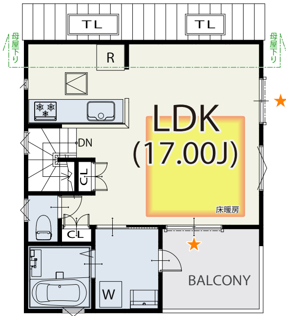
2 FLOOR / 41.40m²