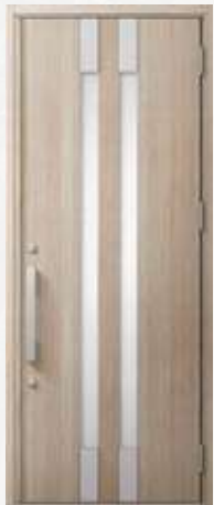
型番：M14 カラー：グレイッシュオーク