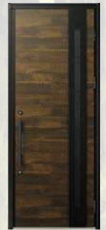
型番：F11 カラー：スモークヒッコリー