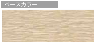
ベースカラー フィオット MWフリーベージュ