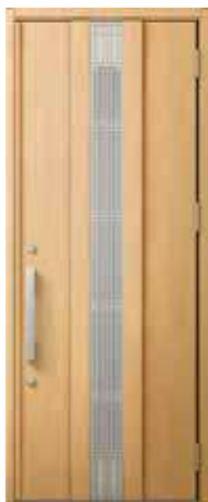
型番：M81 カラー：クリエペール