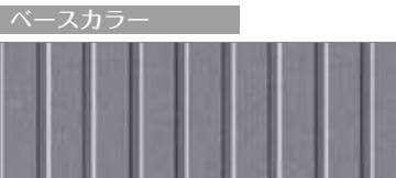
ベースカラー AT-WALL Archi アーバンストライプ 15 カーサチャコール(縦張り)