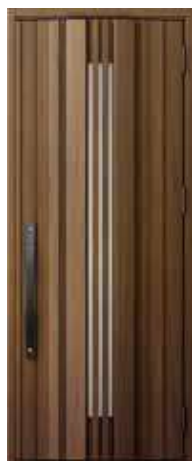
型番：G81 カラー：クリエモカ