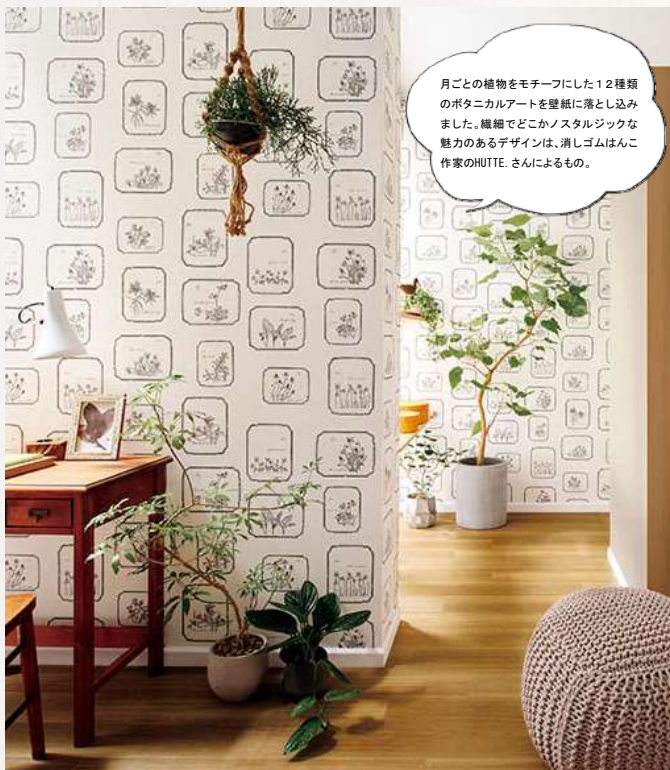
1・2階 トイレアクセント サンゲツ FE74453

月ごとの植物をモチーフにした12種類のボタニカルアートを壁紙に落とし込みました。繊細でどこかノスタルジックな魅力のあるデザインは、消しゴムはんこ作家のHUTTE. さんによるもの。