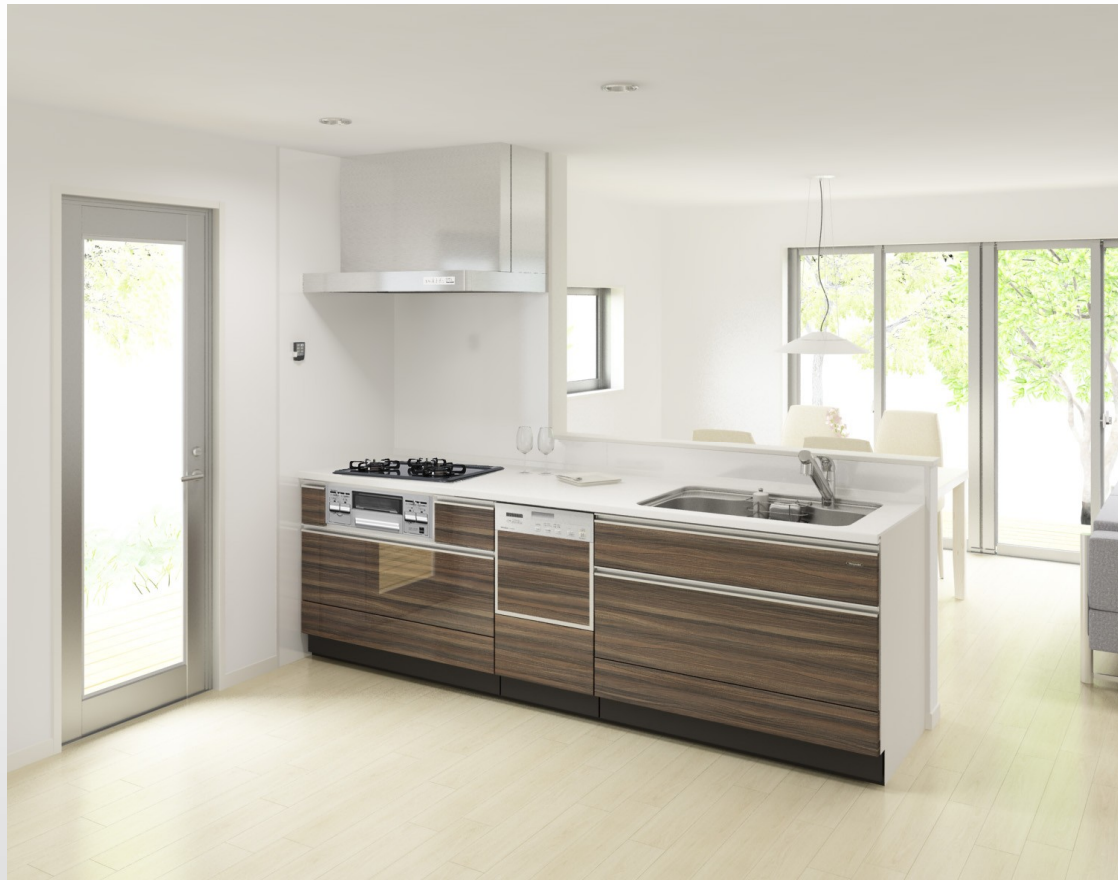
対面型食器洗い機プラン